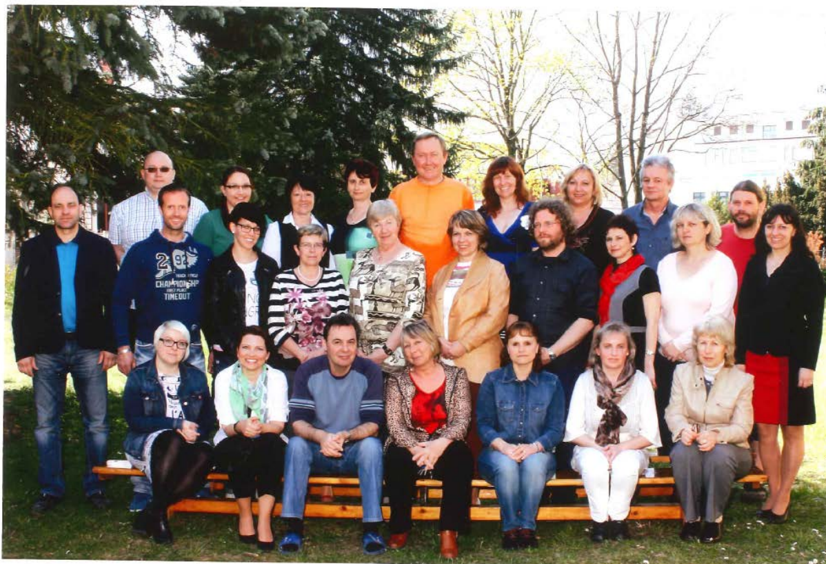
SOŠ a SOU J. Hradec, školní rok 2015 - 2016