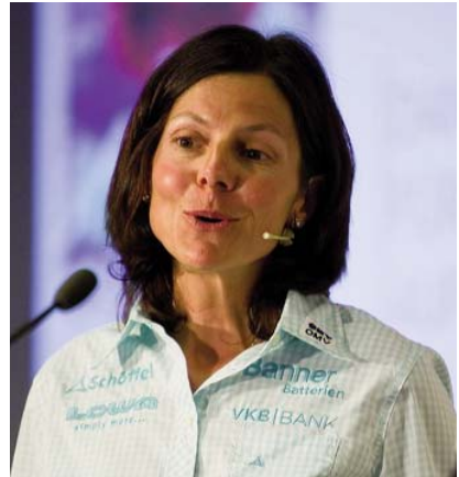
Gerlinde Kaltenbrunner bei ihrem Vortrag